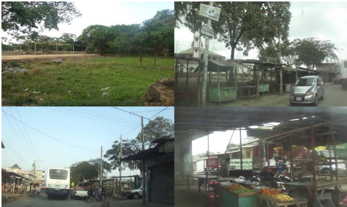
Figura 2. Sector del objeto de estudio, Flor de Bastión. Se visualiza el desarrollo comercial de forma empírica y falta de coberturas de las NBI.

Perimetral, cerca del sector El Fortín. En la figura 2, se puede constatar el mercado informal generado en la zona, como consecuencia de la falta de espacios para el comercio y la ausencia de servicios básicos, donde sus habitantes con NBI buscan desarrollar actividades para subsistir.